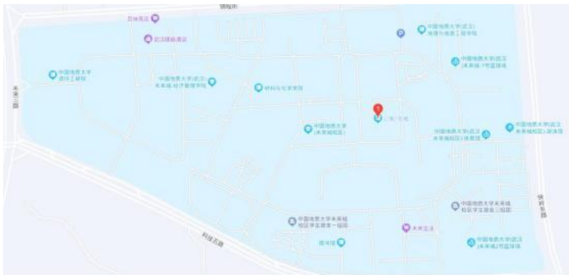
公教1楼在中国地质大学（武汉）未来城校区内的位置